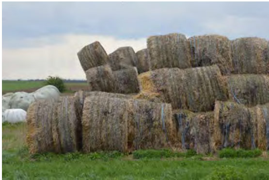
Bild 1: Dieses Rundballenlager gehört unverzüglich abgebaut. Es wurde neben einer Wohnsiedlung errichtet.

Sie können dann entweder aufgelöst oder erneut sicher aufgebaut werden. Zum Ein- und Auslagern sind geeignete Maschinen und Geräte mit Fahrerschutzdach (FOPS) zu verwenden. Das Heben und Transportieren von zwei oder mehreren Großballen übereinander ist unzulässig.