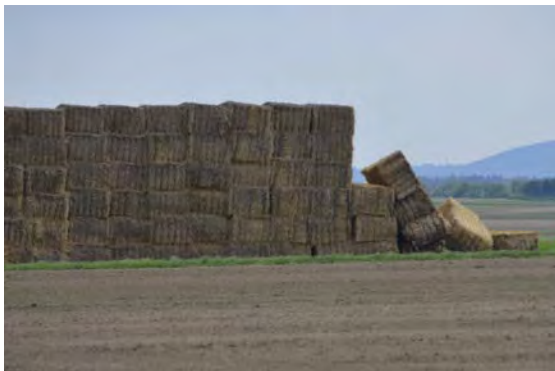
Bild 2: Trotz scheinbar stabiler Lagerung stürzte ein Randstapel um. Grund dafür war die Quellung des Lagers in der obersten Lage durch Nässe und Winterfeuchtigkeit.

Fritz Allinger Friedrich.allinger@svlfg.de