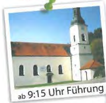
ab 9:15 Uhr Führung