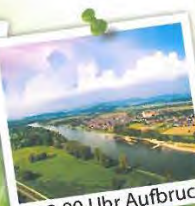
ca. 13:00 Uhr Aufbruch