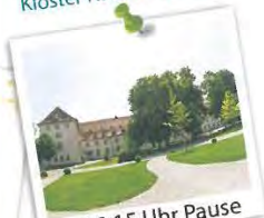
ca. 12:15 Uhr Pause