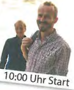
10:00 Uhr Start