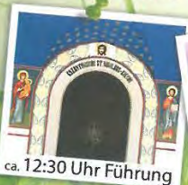
ca. 12:30 Uhr Führung