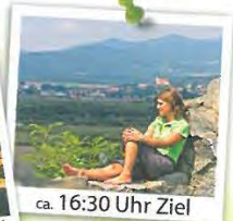
ca. 16:30 Uhr Ziel