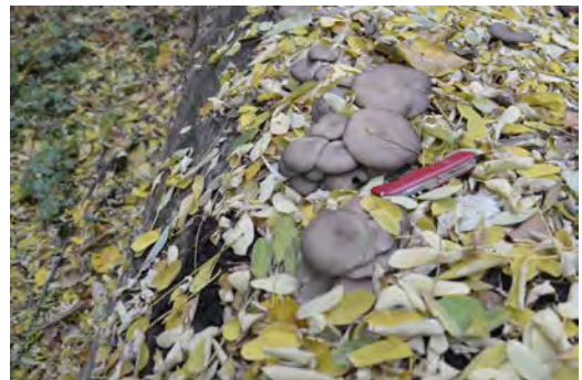
Bild 2: Paniert und frittiert wie Kalbsschnitzel schmecken Austernpilze besonders lecker.

Bild 1: Sehr schöne Exemplare des Austernpilzes (Winterform graublau) auf einer abgestorbenen Pappel in den Donauauen.