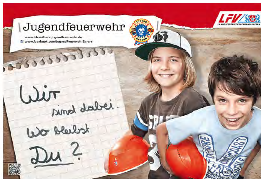
Die FF Hofkirchen