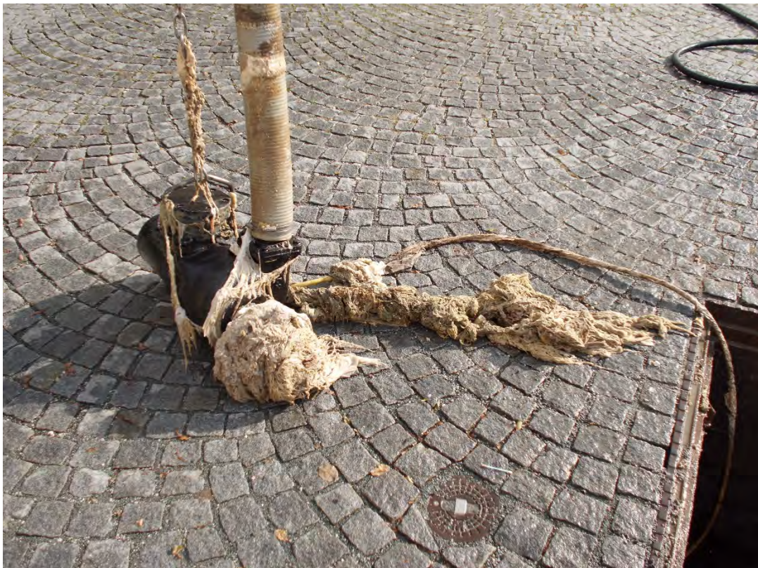
Bild von Putzlumpen, die in der Donaulände das Laufrad verstopften und schädigten: