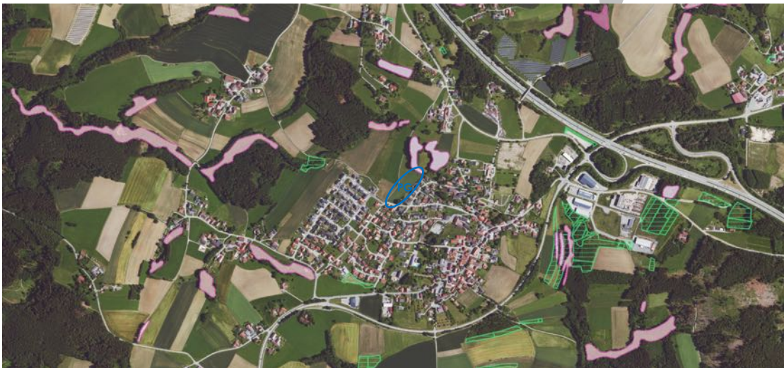
Luftbildauschnitt von Garham aus FIS-Natur Online des LfU mit Daten der Biotopkartierung (rot), Ökoflächen des Ökoflächenkatasters (grün) und Planungsgebiet (PG, blau)