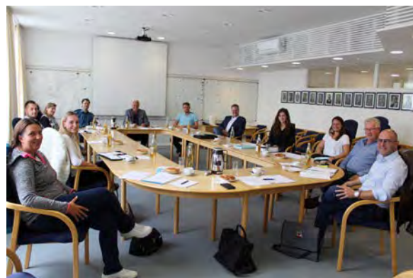
Verwaltungs-Mitarbeiter aus den Mitgliedskommunen der ILE Klosterwinkel beim Erfahrungsaustausch zum Thema Leerstands-Datenmanagement im Rathaus Aidenbach

Zur Frage des weiteren Vorgehens war man sich einig, dass bei der Fortführung des Vitalitätschecks ein gemeinsamer Zeitplan sowie eine abgestimmte interkommunale Wohnraumstrategie zwischen den ILE-Gemeinden notwendig sei. Empfohlen wurde eine Neuauflage zur Erfassung der aktuellen Situation bei Leerständen und Baugrundstücken sowie die Überprüfung neuer Herangehensweisen, wie z. B. die Einrichtung einer gemeinsamen, interkommunalen Immobilienbörse. Ebenso wurden Möglichkeiten zur Optimierung des Informationsaustausches innerhalb der Verwaltung angesprochen.