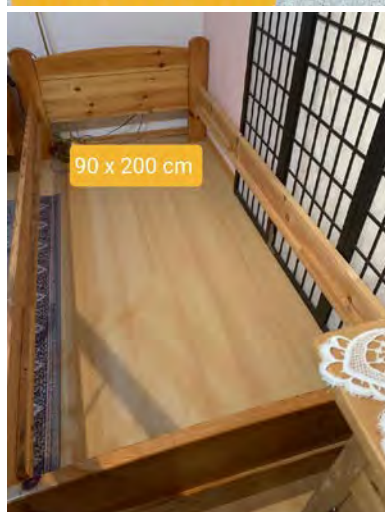
90 x 200 cm