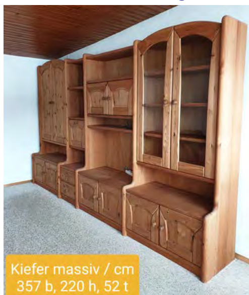
Kiefer massiv / cm 357 b, 220 h, 52 t