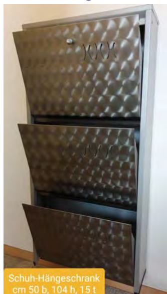
Schuh-Hängeschrank cm 50 b, 104 h, 15 t