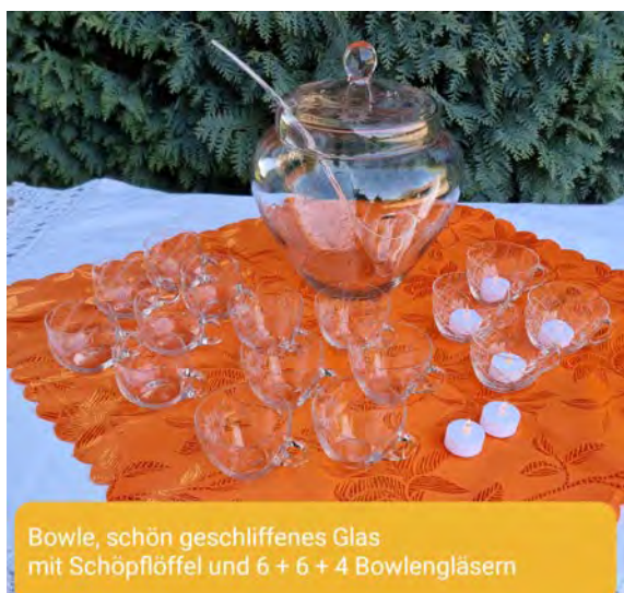
Bowle, schön geschliffenes Glas mit Schöpflöffel und 6 + 6 + 4 Bowlengläsern

oder wie wäre es mit dieser nostalgischen Bowle bzw. diesen festlichen Gläsern: