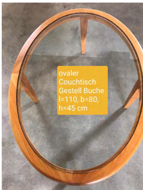
ovaler Couchtisch Gestell Buche l=110, b=80, h=45 cm